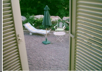
La Maisonette du Jardin (vue de la fenetre)