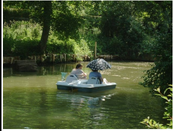
etang de moulin