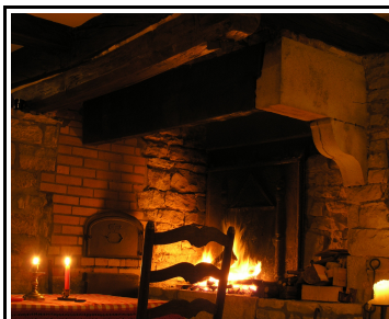
chambre avec cheminee