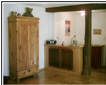
La Cachette (cuisine)